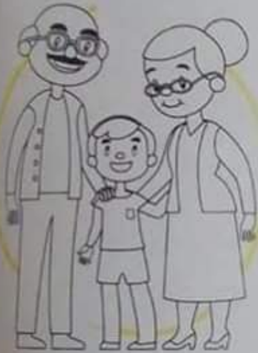
أَزُورُ جَدِّي وَجَدَّتِي.